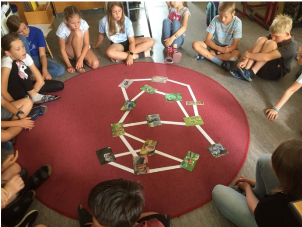
Zusammenhänge im Nahrungsnetz.... Maus frisst Nuss, Fuchs frisst Maus ....

Alle Lebewesen sind aufeinander angewiesen – wie das Beispiel des Nahrungsnetzes beweist.