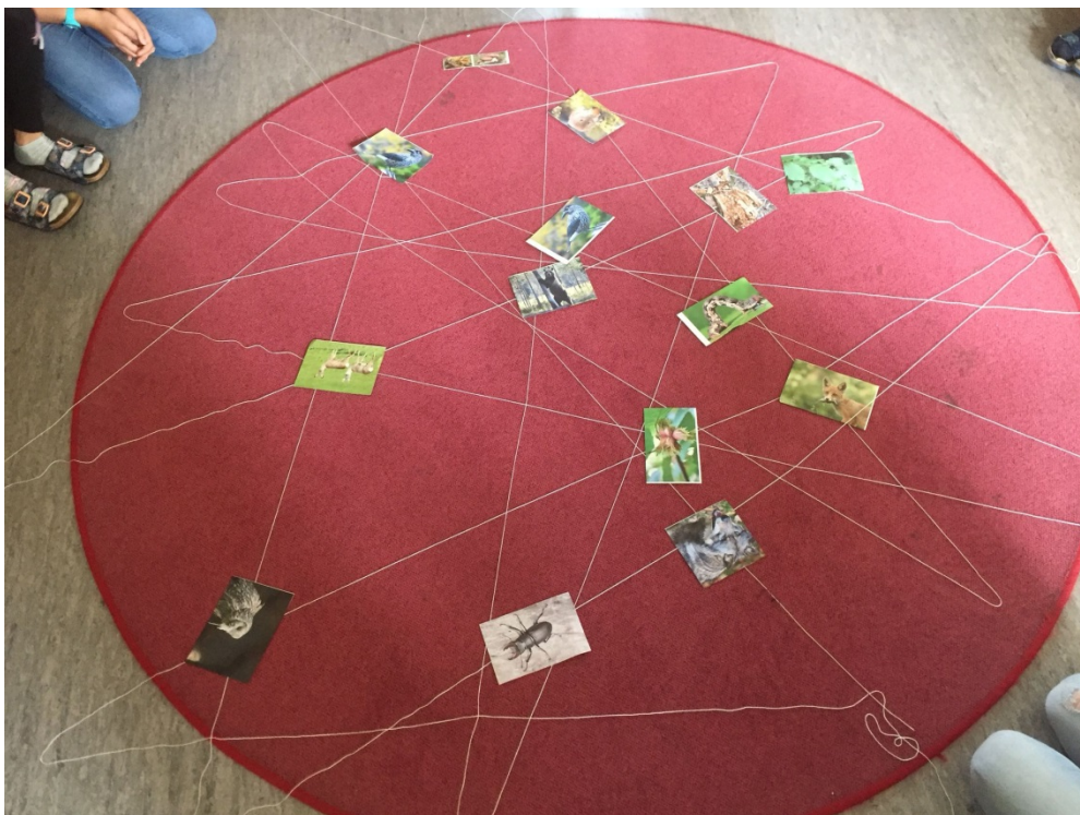
Ein empfindliches Gebilde im Gleichgewicht ....

Und was passiert, wenn nur eine Pflanze, ein Tier fehlt oder ausstirbt? Das Gleichgewicht ist gestört – denn alle Lebewesen sind miteinander verbunden!