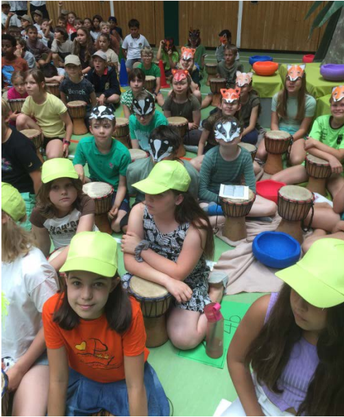
Die Farbe Grün wartet auf ihren Probenauftritt.