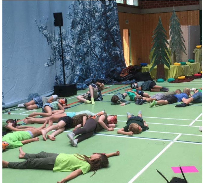
Die Erde, sie war wüst und leer....